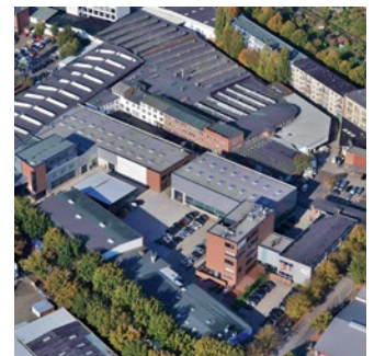
Die ZAE-AntriebsSysteme GmbH & Co. KG ist ein Hamburger Maschinenbauunternehmen, das 1919 als Zahnradfabrik Altona Elbe GmbH gegründet wurde.

Im ersten Schritt wurde eine Markt- und Wettbewerbsanalyse erarbeitet und der kommunikative Auftritt von ZAE bezüglich Stärken und Schwächen bewertet, eine Bestandsaufnahme aller Marken-Kontaktpunkte erstellt und die Herausforderungen und Ziele definiert. Die Kernargumente von ZAE gegenüber den relevanten Zielgruppen und ihren Anforderungen wurden präzisiert und in der Customer Journey verortet. Die Markenwerte wurden in diesem Kontext geschärft.